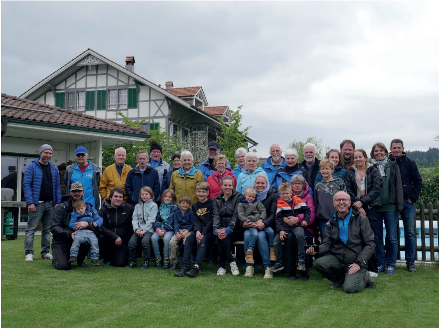
TBM-Turnfahrt Auffahrt 2023, Biglen