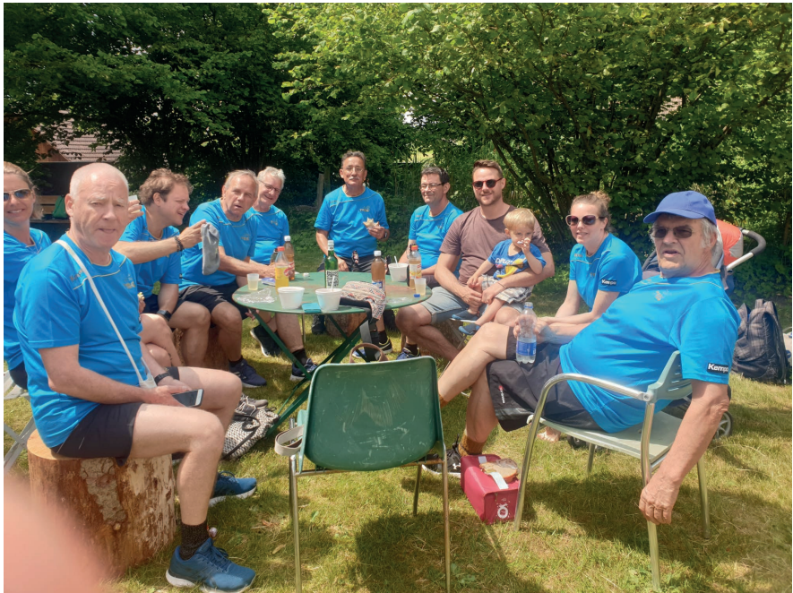
Redlich verdiente Pause nach getaner Arbeit